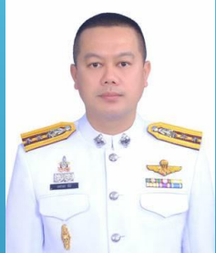
พ.ต.อ.เดชาธร ติมี คณะกรรมการกต.ตร.สภ.เป็อยน้อย