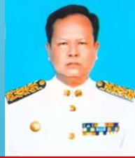
นายนิกร เทศต้อม ประธาน กต.ตร.สภ.เป็อยน้อย