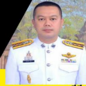
พ.ต.อ.เดชาธร ตีมี ผกก.สภ.เป็อยน้อย

🌐 https://pueainoi.khonkaen.police.go.th